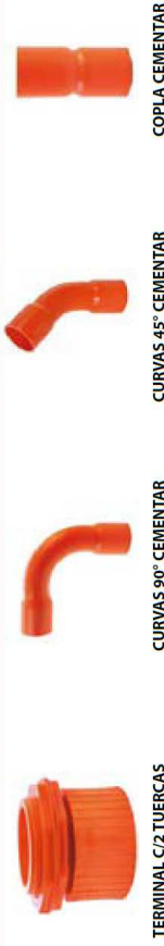
TERMINAL C/2 TUERCAS