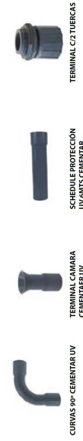
CURVAS 90° CEMENTAR UV